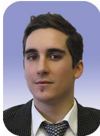
Philipp Schmucker Versicherungen